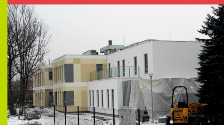
Rozbudowa przedszkola przy ul. Dużej