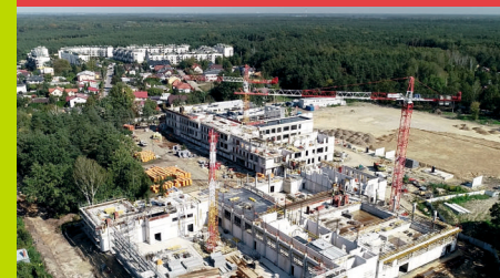
Mareckie Centrum Edukacyjno-Rekreacyjne