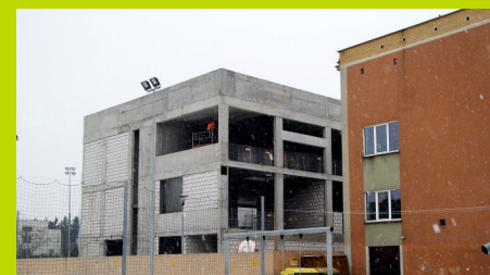
Rozbudowa SP2 przy ul. Szkolnej