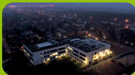
Rozbudowana Szkoła Podstawowa nr 2 przy ul. Szkolnej