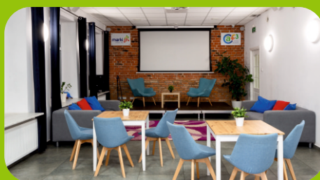
Centrum Aktywności Fabryczna 3