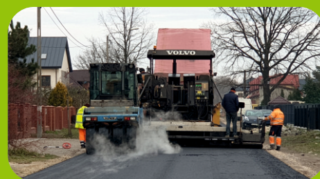
Realizacja nakładek asfaltowych