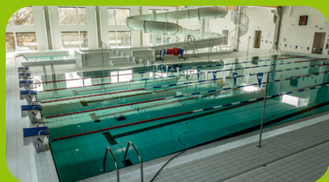
Mareckie Centrum Edukacyjno-Rekreacyjne przy ul. Wspólnej z basenem, halą sportową i widowiskową