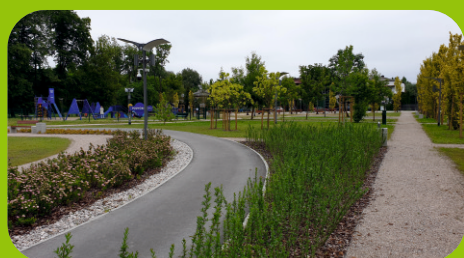
Plac miejski przy ul. Sportowej