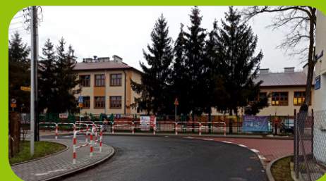
Nowy dojazd do Zespołu Szkół nr 2 przy ul. Wczasowej